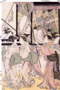
見立唐人行列 喜多川歌麿 寛政 9-10年 (1797-98) 紙本木版多色摺

江戸時代の朝鮮王朝との外交関係に関する記録に出て来る言葉で「誠信」という言葉があります。江戸時代中期に活躍した儒学者の雨森芳洲(1668~1755)はその著作の「交隣提醒(こうりんていせい)」のなかで、「誠信と申し候は、実意と申す事にて、互いに欺かず争わず、真実を以て交り候を、誠信とは申し候」と述べています。「実意」とは「誠意のこもった思いやりの気持ち」、「まごころ」という意味なので、「誠信交隣」とは、まごころをもって隣国と交流することを意味します。江戸時代の日本と朝鮮王朝との外交はこの「誠信交隣」を基として200余年平和で対等な関係を維持しました。