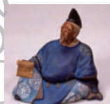
色絵備前柿本人麻呂像香炉 18世紀

岡山県備前市周辺を産地とし、中世から続く日本を代表する陶器、「備前焼」。本展では、その歴史と、現在も活躍する作家の作品を紹介します。