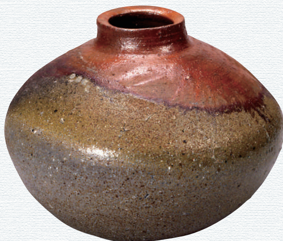
《備前壺花瓶》金重陶陽