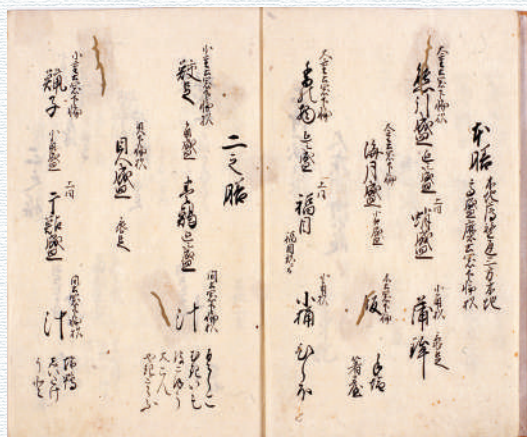
《朝鮮人御饗応献立》・延享5年(1748)・紙本木版墨刷・冊子装