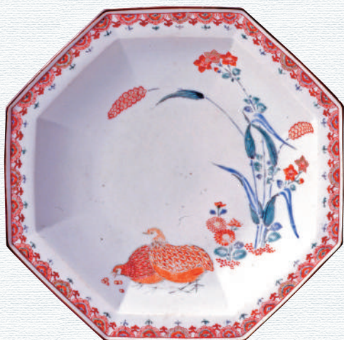
《色絵粟鷄文八角皿》(柿右衛門様式) 1690-90年代