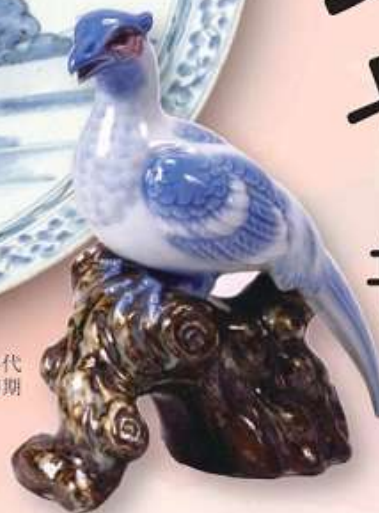
「染付山水文大皿」初期伊万里/1630-40年代 「雑置物」平戸/江戸時代末期-明治初期