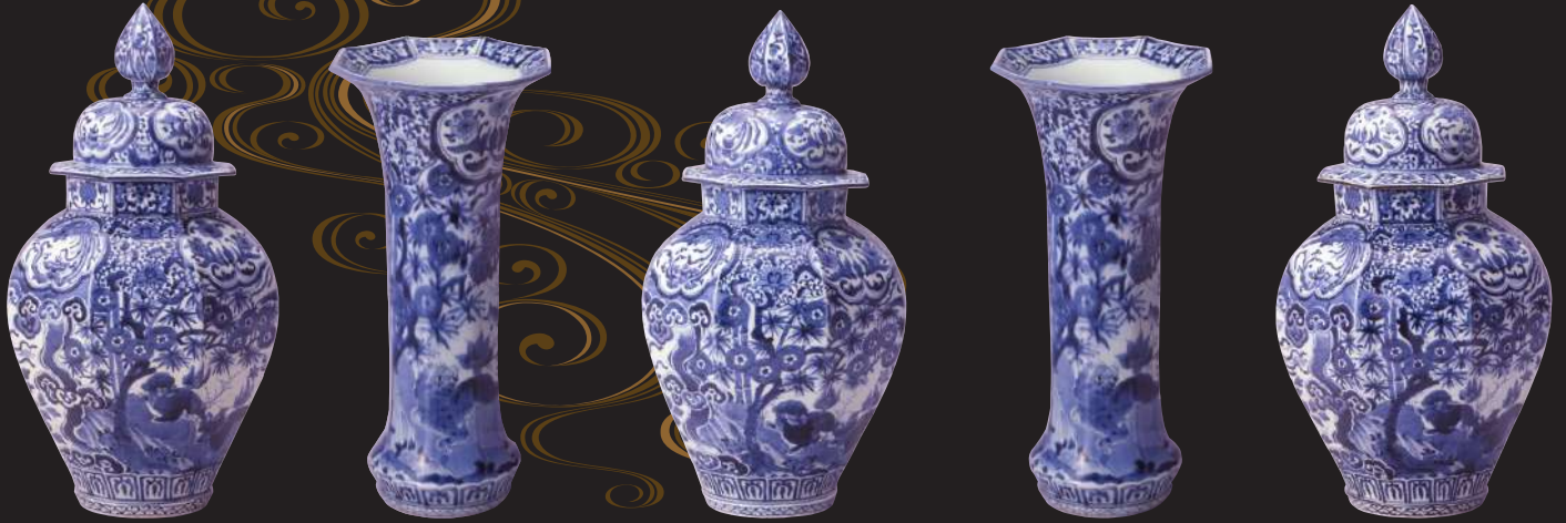
染付牡丹鳳凰文蓋付壺 元禄様式 (1690-1730年代) / 染付牡丹鳳凰文瓶 元禄様式 (1690-1730年代)