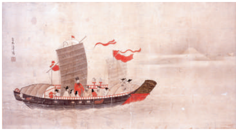
「朝鮮船図」紙本着色 軸装 後期

朝鮮通信使の船の旅は朝鮮半島の南の釜山から始まります。釜山から大型の外洋船である朝鮮通信使船6隻に分乗し、まずは対馬を目指します。朝鮮通信使の中には正使・副使・従事官という一行の代表があり、その3名が乗る船のことを騎船とよび、その船に付く荷物船のことを卜船とよびました。こうして6隻の船が対馬に着くと対馬藩の船が水先案内兼警護に数十隻付き、壱岐・藍島を目指します。そして下関を通り、上関、下蒲刈へと進み大阪を目指します。大阪からは幕府や西国諸藩が用意した豪華絢爛な川御座船に乗りかえ淀川を進み、京都の淀より陸路を歩み江戸を目指します。