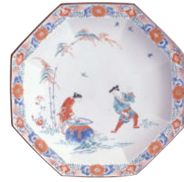
「色絵裏割唐子文八角皿」 柿右衛門様式・1670-90年代