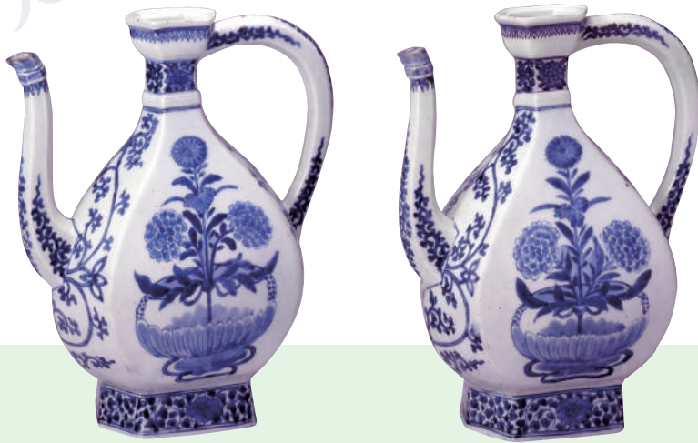
「染付花盆唐草文手付水注」 延宝様式・1660-80年代