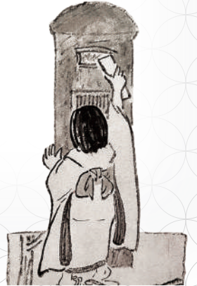
竹久夢二「郵便」(部分)紙・墨