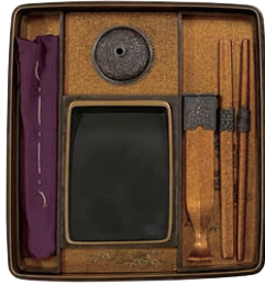
《平日地初音時絵硯箱》漆