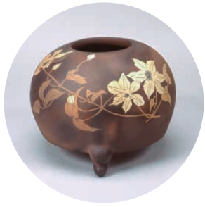
今井政之《象嵌彩鉄線鼎壺》陶器