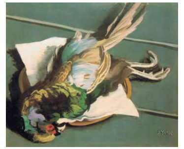
安井曾太郎《雉子》油彩・キャンバス