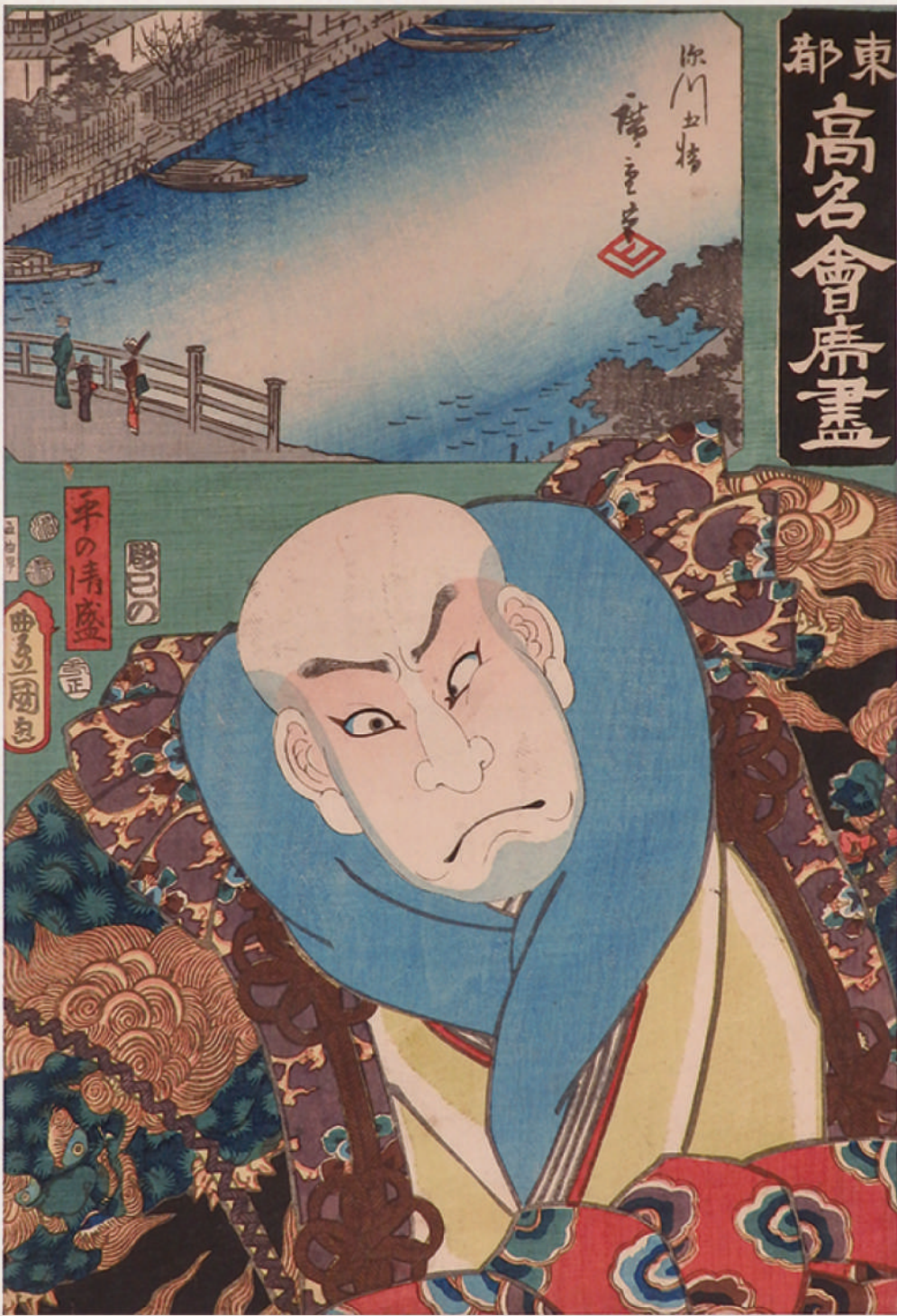
歌川広重 (初代) 歌川豊国 (三代) 《東都高名会席盡 四代目中村歌右衛門の平清盛》1853年 紙・木版