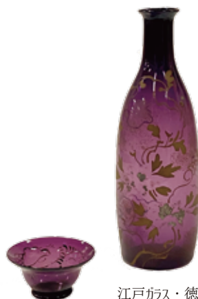
江戸ガラス・徳利と猪口