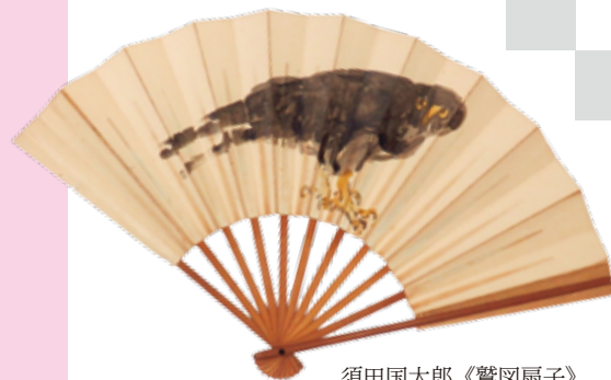
須田国太郎《鶯図扇子》 紙本墨画淡彩