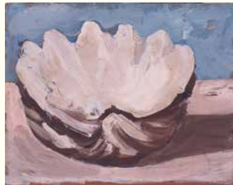
三岸好太郎「貝殻」1934年