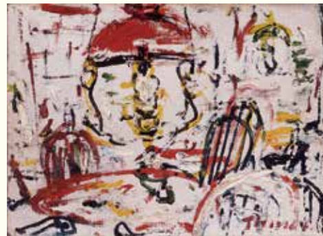
長谷川利行「新宿風景」1937年