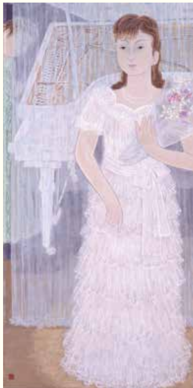
池田栄廣「アンコール」1986年

ぜひこの機会に「音」を目で見えて想像しながら、美術作品の新たな楽しみかたを探ってみませんか。