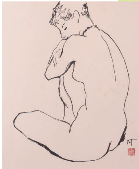
図版：寺内萬治郎 てらうちまんじろう「裸婦」制作年不詳 紙・木版

寺内萬治郎は明治 23 (1890) 年に生まれた洋画家です。本展では、所蔵品の中から寺内萬治郎の油彩画、素描などを紹介します。