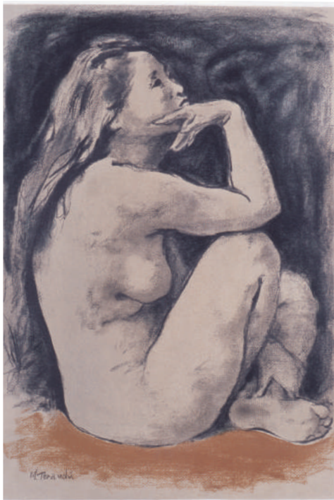
図版：寺内萬治郎 てらうちまんじろう『裸婦』制作年不詳 紙・リトグラフ

寺内萬治郎は明治 23（1890）年に生まれた洋画家です。東京美術学校西洋画科（現・東京芸術大学）に入学し、油彩技法の正統を学んだ寺内萬治郎は、裸婦表現を生涯にわたり追求しました。