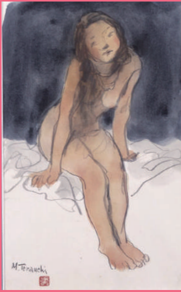
図版：寺内萬治郎「裸婦」 制作年不詳 紙・水彩、鉛筆

寺内萬治郎は明治 23 (1890) 年に生まれ、大正、昭和にかけて日本近代洋画史に名前を刻む画家です。画家を志した寺内萬治郎の青年時代は、黒田清輝や藤島武二らが明治洋画壇を牽引し、西欧美術の新しい息吹がもたらされた時代でした。そのような環境で油彩技法の正統を学んだ寺内萬治郎は「裸婦の寺内」と称されるほど、生涯にわたり日本女性の美しさを追究しました。