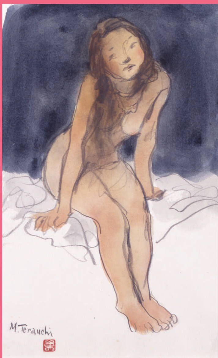
図版：寺内萬治郎「裸婦」 制作年不詳 紙・水彩、鉛筆