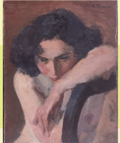
図版：寺内萬治郎「裸婦」1950（昭和 25）年 キャンバス・油彩