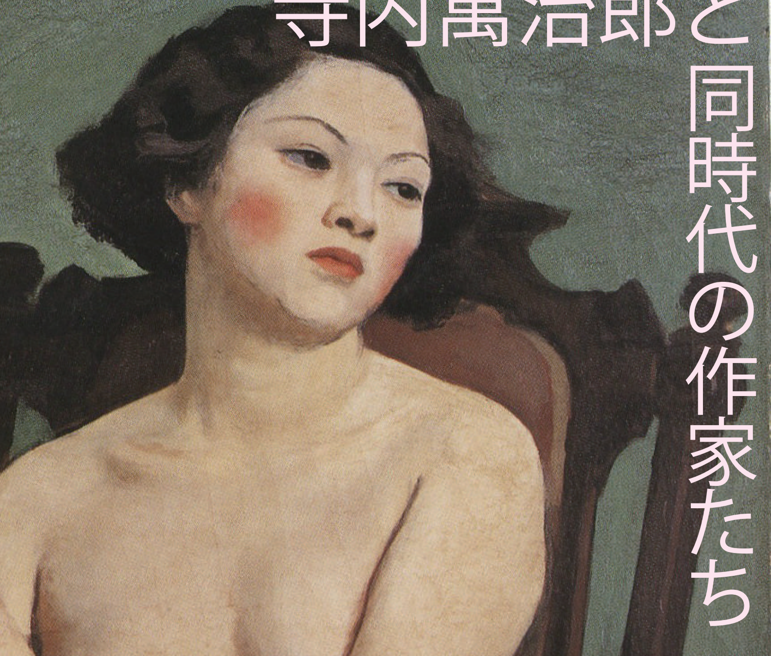
寺内萬治郎「裸婦」(部分) 1937(昭和12)年 キャンバス・油彩 73.0×61.2cm

寺内萬治郎の代表的油彩画と共に、交流のあった洋画家の作品を紹介します。明治から昭和にかけて活躍した洋画家たちの多彩な作品をご覧ください。