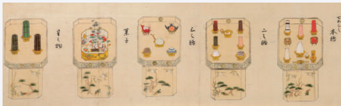
《祝言膳部次第》(部分)・寛永5年(1628)・紙本着色・卷子装