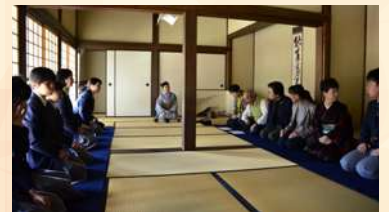
※写真は例年の様子